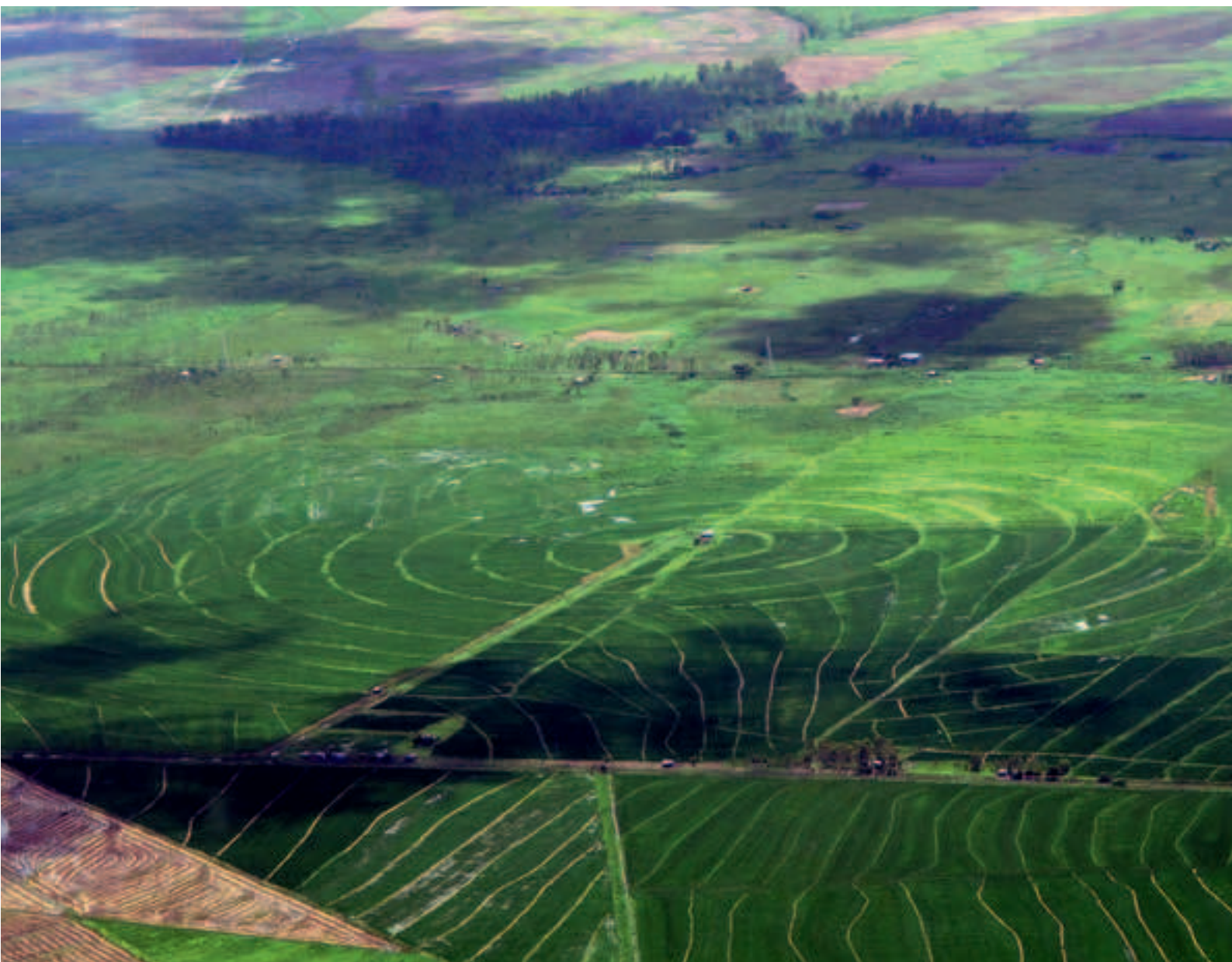
Reisfeld in der Umgebung von Managua, Hauptstadt von Nicaragua

nahmen den Grossgrundbesitzern das Land weg und verteilten dieses an Kleinbauern, Kooperativen und Staatsbetriebe. Dabei wurden jedoch keine Grundbücher geführt und die Begünstigten hatten und haben keine Landtitel in der Hand – was sich bis heute auswirkt. Die